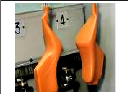
Resim- 1: Üretim aşamasında kalıplar.

Kalıp; saya (ayakkabının üstü) ve tabanın üzerine monta edildiği, ayakkabının şeklini ve ölçüsünü vermek ya da ayakkabının oluşmuş şeklini korumak amacıyla kullanılan çeşitli malzemelerden üretilmiş ayak biçimindeki gereçtir. Ayakkabı üretimi için gerekli en önemli demirbaş kalıptır (Kastan, 2007).