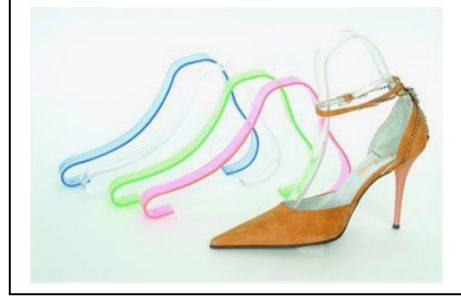
Resim- 4: Deve boynu form kalıbı.

Birçok kalıpta künye (gönye) adı verilen bir parça bulunur. Künye, kalıbın ayakkabı içinden kolayca çıkmasını sağlayan, kalıbın üst bölümünde yer alan, takılıp çıkarılabilen bir parçadır (TS 2336, 1976).