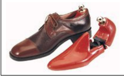
Resim- 3 : Kıрма form kalıbı.

Resim- 1 ve 2’de ayakkabı üretiminde kullanılan kalıplar görülmektedir. Alttaki resimlerde (Resim- 3 ve 4) ise mamül ayakkabının şeklini muhafaza etmek için kullanılan kalıp örnekleri yer almaktadır.