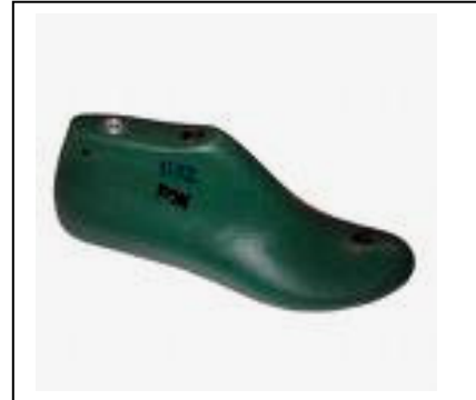
Resim- 2: Kalıp.